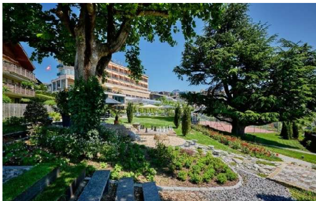
Hotel Eden ****s

Weitere Infos über das Hotel findest du direkt auf der Hotelwebsite: www.eden-spiez.ch